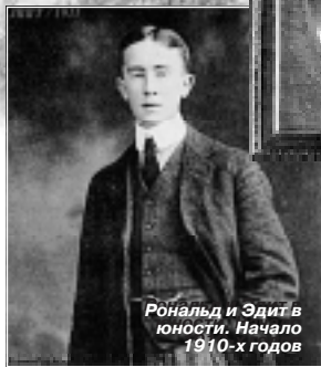
Рональд и Эдит в юности. Начало 1910-х годов