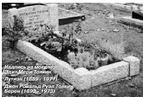
Надпись на могиле: Эдит Мери Толкин Лутизн (1889 - 1971) Джон Рональд Руэл Толкин Берен (1892 - 1973)

Это не было отсутствие характера, как может показаться на первый взгляд. Это было доверие, готовность пожертвовать своими желаниями ради любимого человека.