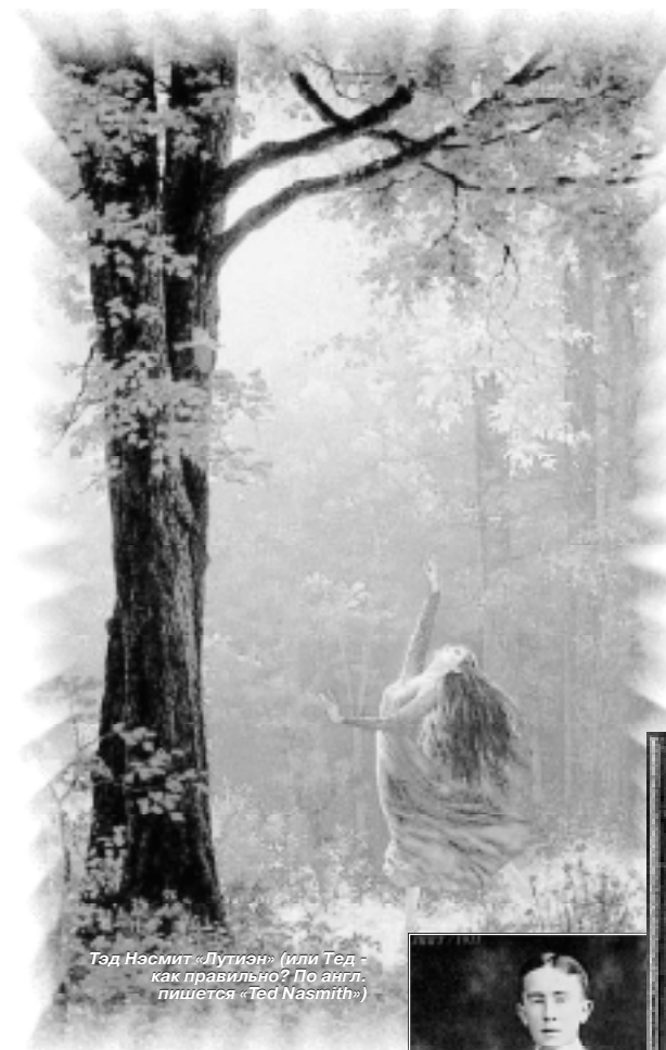
Тэд Нэсмит «Лутизн» (или Тел - как правильно? По англ. пишется «Ted Nasmith»)

«Она была совершенно свободна, не связана никакими клятвами... и у меня не было бы никакого права жаловаться, если бы она вышла замуж за другого»